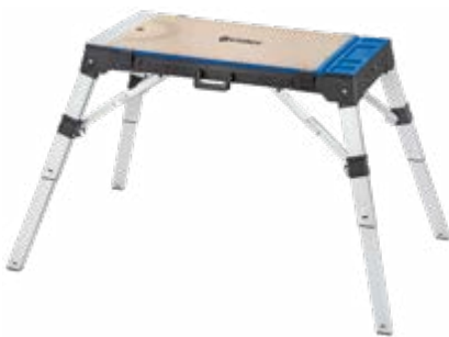
Table polyvalente. Sert de plateforme de travail, d'établi ou de planche à roulettes. Réglable en hauteur 3 paliers, jusqu'à 80 cm. Plan de travail 95 cm x 46,5 cm réversible. Très robuste, supporte des charges de jusqu'à 150 kg.