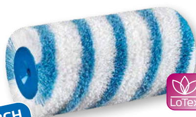
DuraSTAR 21 Couvrir encore plus de surface rugueuse