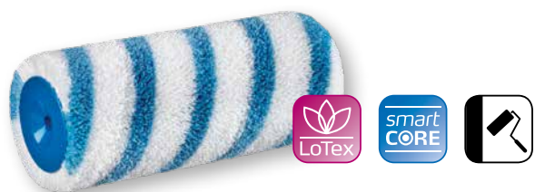
DuraSTAR 12 Très performant sur surface lisse