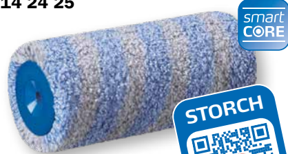
FineSTAR 15 Restitution élevée. Finition fine.