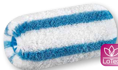
DuraSTAR 21 L'expert des angles grossiers