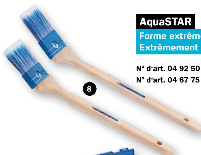
AquaSTAR Forme extrêmement stable. Extrêmement durable.