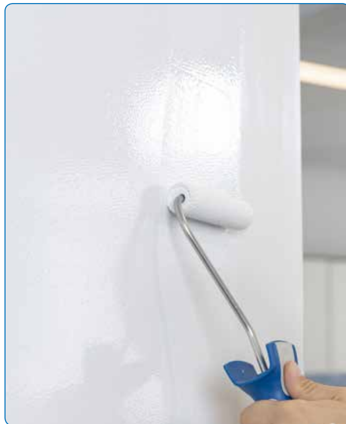
Répartition optimale du matériau sur les surfaces.