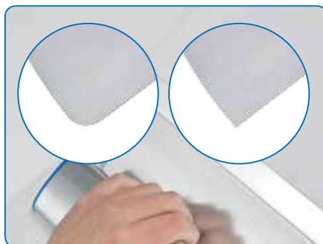
Lame de 0,3 mm aux angles arrondis pour un aplanissement lisse et des travaux ultérieurs de finitions minimales