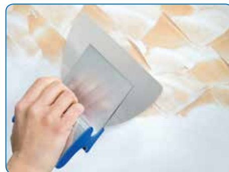
Les largeurs plus réduites sont aussi idéales pour des techniques décoratives de qualité