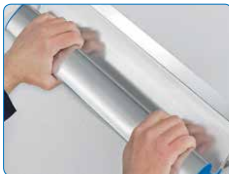
Guidage à deux mains et donc nécessitant peu d'efforts pour les largeurs importantes