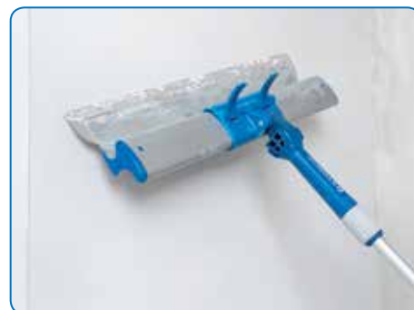
L'adaptateur FlexoGrip Alustar pour la perche télescopique LOCK-IT est disponible séparément pour le travail facile des plafonds ou autres surfaces murales en hauteur sans échelle