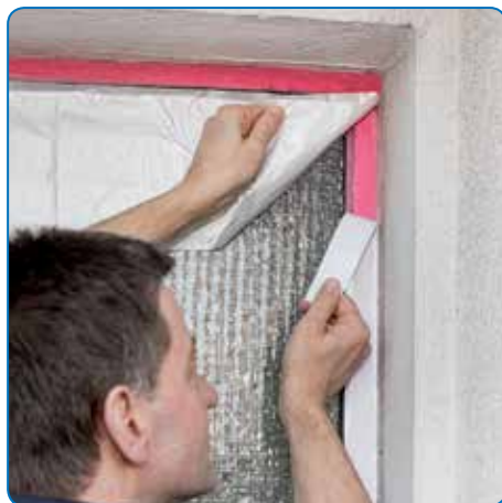
Mise en œuvre ne causant aucun problème sur les supports sensibles aux plastifiants