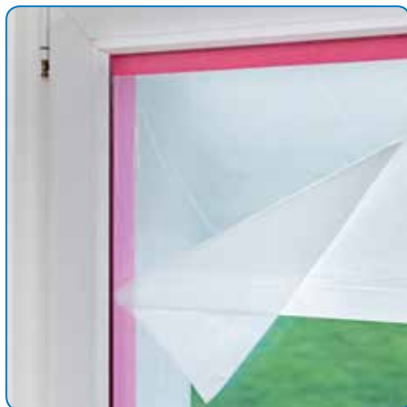
Colle résistante aux UV pour l'exposition directe au soleil