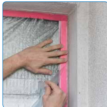
Fixation rapide et précise des CQ et des feuilles plastiques