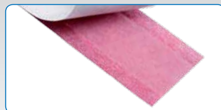
Bordures sans colle des deux côtés

Exclusivement chez STORCH - Brevet en cours d'attribution