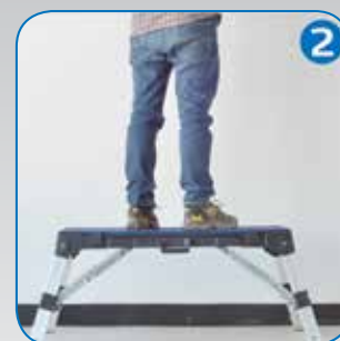
Surface de travail.