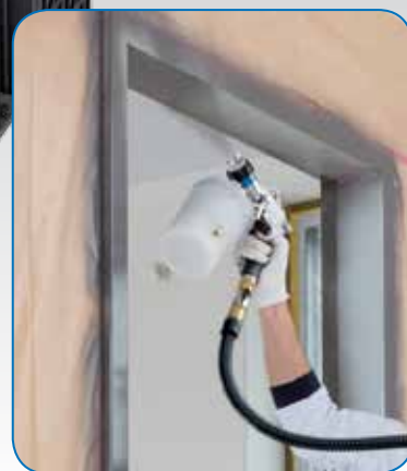
Utilisation à 360° - même en haut

Pour peindre en toute flexibilité dans toutes les directions